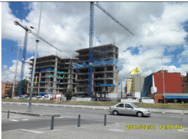
Fotografía No. 2 Vista fachada del predio TRANSVERSAL 60 No 114A-10 No se encuentra instalada la valla tubular comercial