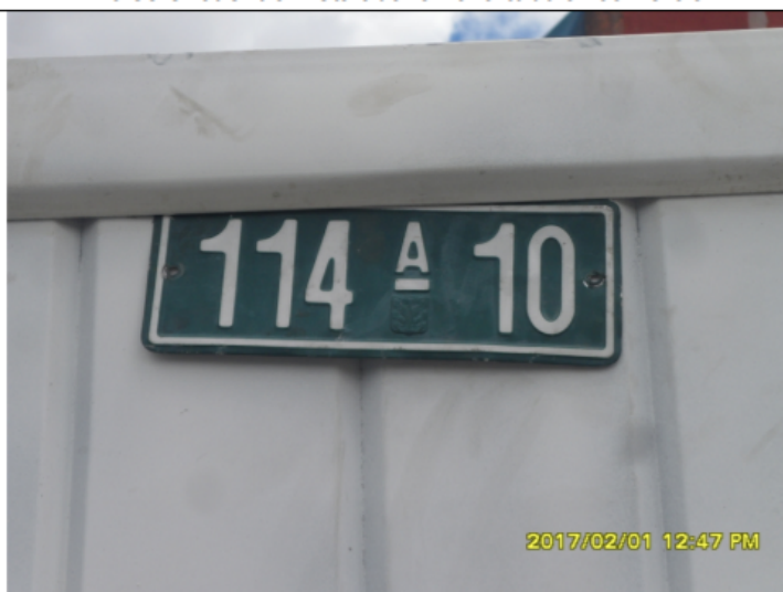
Fotografía No. 3 Nomenclatura del inmueble donde se realiza en seguimiento y control de la valla tubular comercial.